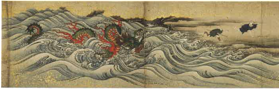
ちへんじ 龍伝説が残る池辺寺の物語を伝える絵巻 熊本市指定有形文化財《池辺寺繰起絵巻》 文化元年(1804) 池辺寺跡財宝管理委員会蔵(熊本県立美術館寄託)