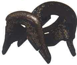
鎌倉時代の貴重な螺鈿鞍 重要文化財《巴螺鈿鞍》 鎌倉時代(13世紀) 熊本県立美術館蔵