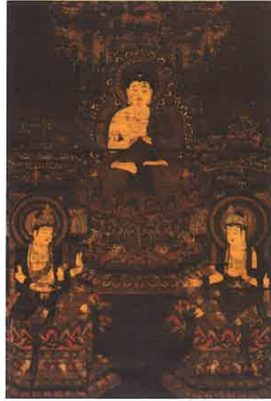
極楽浄土の世界を描いた鎌倉時代の仏画 (後期展示) 熊本県指定重要文化財 《阿彌陀三尊図》鎌倉時代(14世紀) 往生院蔵

現在、熊本市域には240件を超える国・県市の指定文化財があります。平安時代の仏像、鎌倉時代の仏画、寺社に奉納された刀など、いずれも熊本市の歴史を知る上では欠かせないものばかりです。当館創立70年を記念して開催する本展覧会では、こうした熊本市域に残る指定文化財を一堂にご紹介します！ この機会に熊本市の「宝もの」のミリョクを味わってみませんか？